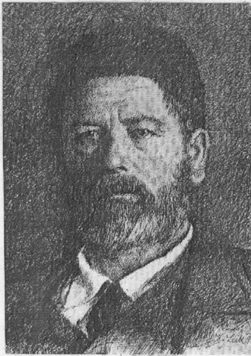
W. Leibl, Selbstporträt 1896.